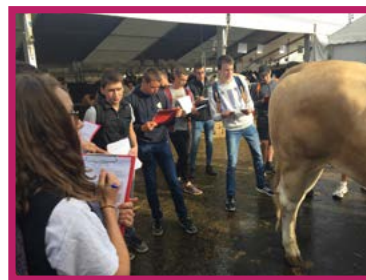
Concours de pointage bovin au festival de Chemillé