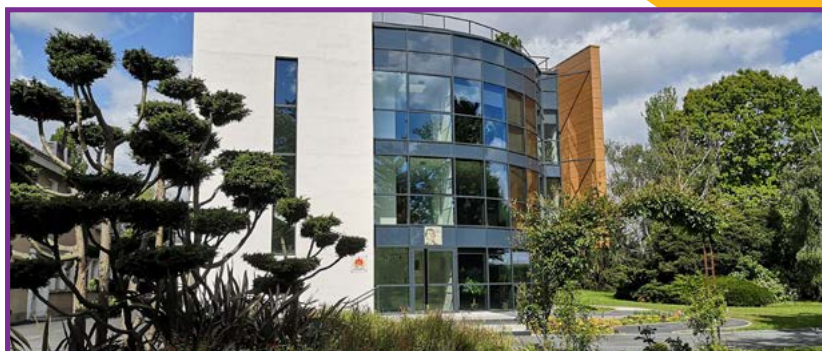
Le nouvel internat accueille les élèves depuis la rentrée 2018

Plus de 80% de nos élèves sont internes.